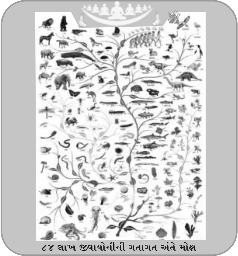
૮૪ લાખ જીવાયોનીની ગતાગત અંતે મોક્ષ

આ થોકડો શીખી વારેવારે પરિચટ્ટણા કરવાથી મનની એકાગ્રતા વધે છે. ચંચળ મનને એકાગ્ર કરવા આ થોકડો શ્રેષ્ઠ ઉપાય છે. તે ઉપરાંત ગુણસ્થાનક, ગતાગત, દંડક, યોગ, ઉપયોગ, લેશ્યા વિશેનું જ્ઞાન તાજું રહે છે.